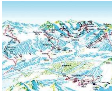
Innsbruck, Tirol, Austria

575 - 2'334 m. >>Innsbruck Tirol Capital de la región del Tirol y de los Alpes con su historia de hace 800 años, unida de modo armónico e interesante naturaleza, cultura, deporte y tradiciones y conserva el atractivo de una ciudad universitaria y de congresos internacionales. El rico patrimonio cultural y la fama como ciudad de dos olimpiadas con instalaciones para atletas y lugar atrayente como meta de visita, vacaciones los 365 días del año. Innsbruck Card: 1 billete de transporte público, visitas guiadas en autobús, 23 museos y monumentos y cabina/tren de montaña. Animada ciudad histórica, con 128'000 habitantes, al pie de la cordillera Nordkette. Piscina cubierta, centro de bienestar físico, gimnasio, sauna, masajes, thalassoterapia. Conexiones: estación de tren en la población. Para llegadas en avión: aeropuerto Innsbruck (INN), München Franz Josef (MUC).